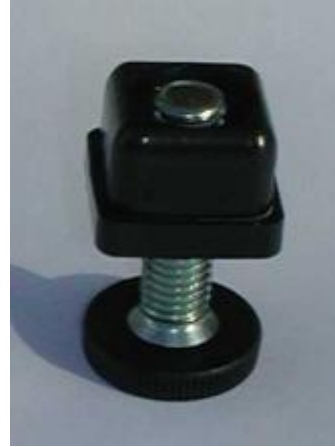
Förhöjningsfot för att höja upp sektion från golv möjliggör spolning av golvet. (tillbehör)

Trans-Naval AB Ekholma 2438 288 93 Nävlinge Tel 044-822 00 Fax 044-822 01