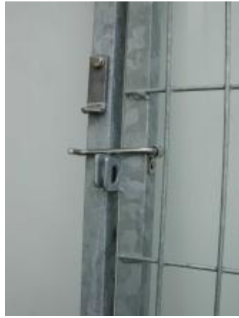
Detaljbild på dörrens hänglåsbeslag med anhäng. Dörren öppnas inåt. (Här kompletterad med överfallslås)