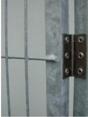
Detaljbild på rostfria gångjärnet som lackats för att förhindra galvaniskt element