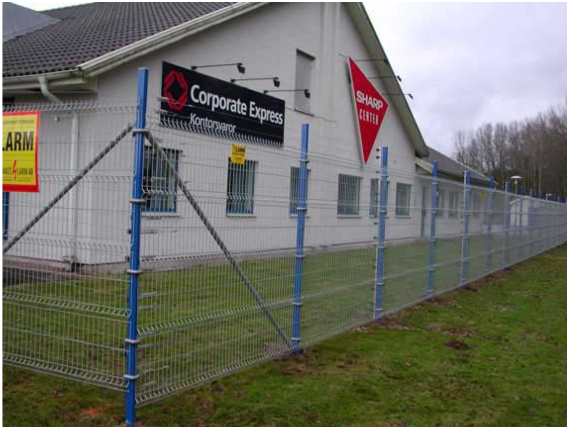
Hercules monterat tillsammans med Staketlarm

Trans-Naval AB Ekholma 2438 288 93 Nävlinge Tel 044-822 00 Fax 044-822 01 www.transnaval.se