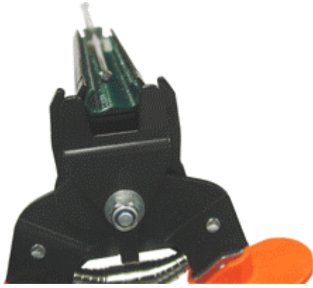
Natringtång med magasin